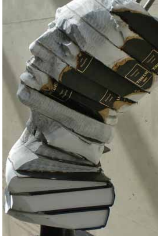
Papierkunst: de spreker gebeeldhouwd uit bijbels

Hoe spreek je profetisch en blijf je tegelijk een pastor voor je hele gemeente? Ik merk dat het pastorale bij mij de boventoon voert. Liever ben ik de verbindende herder die zijn kudde