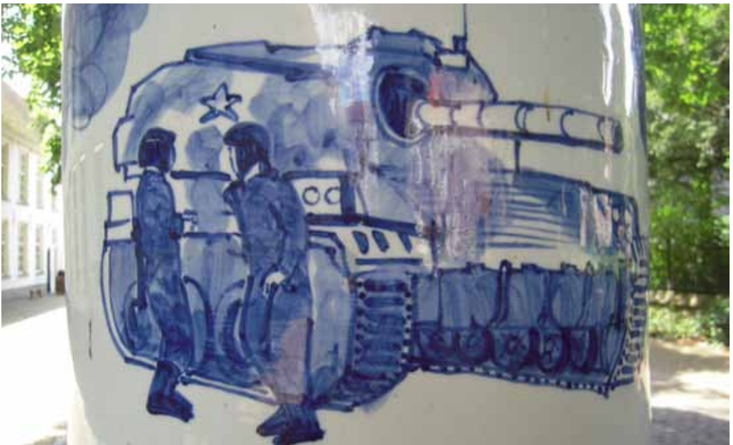
Delftsblauw op een lantaarnpaal in Delft